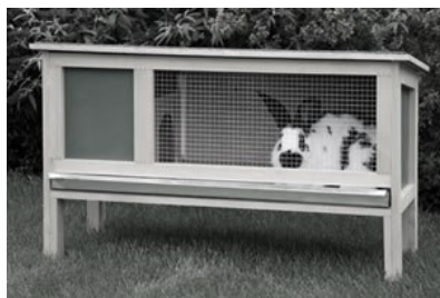
15. ábra Kültéri elhelyezésre alkalmas ketrec